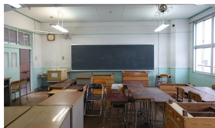
リノベーション前の空き教室